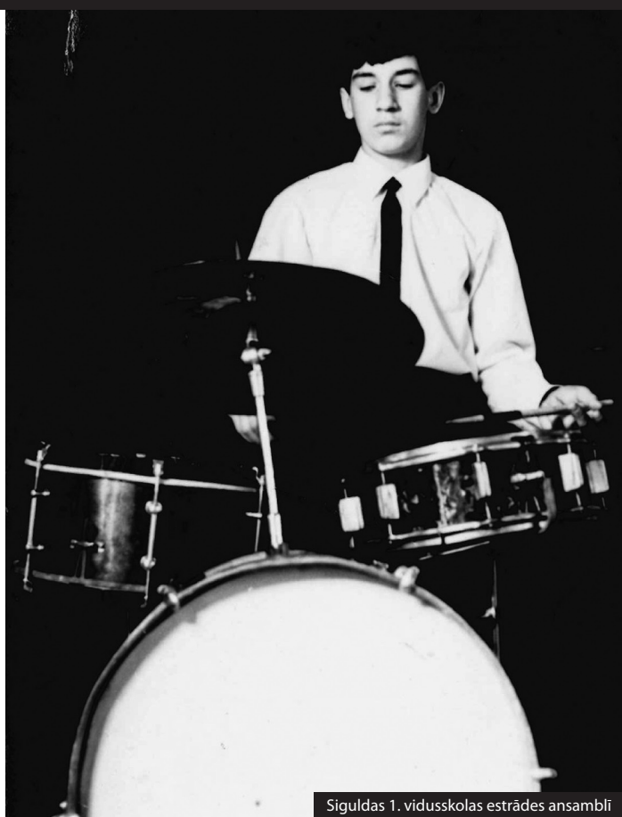
Siguldas 1. vidusskolas estrādes ansamblī