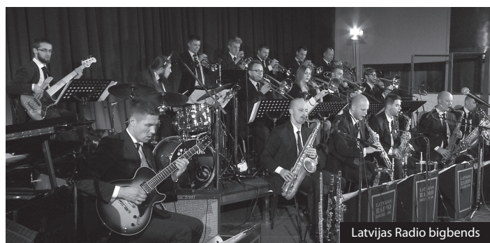
Latvijas Radio bigbends

MB: Ir gan! Un mums vēl ir otrs uzdevums – izglītot klausītājus. Protams, nav tādu resursu, lai šejienes publiku iepazīstinātu ar tā sauktajiem kulta mūziķiem, taču, šķiet, esam vienīgi, kas uz