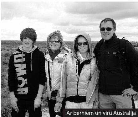
Ar bērniem un vīru Austrālijā