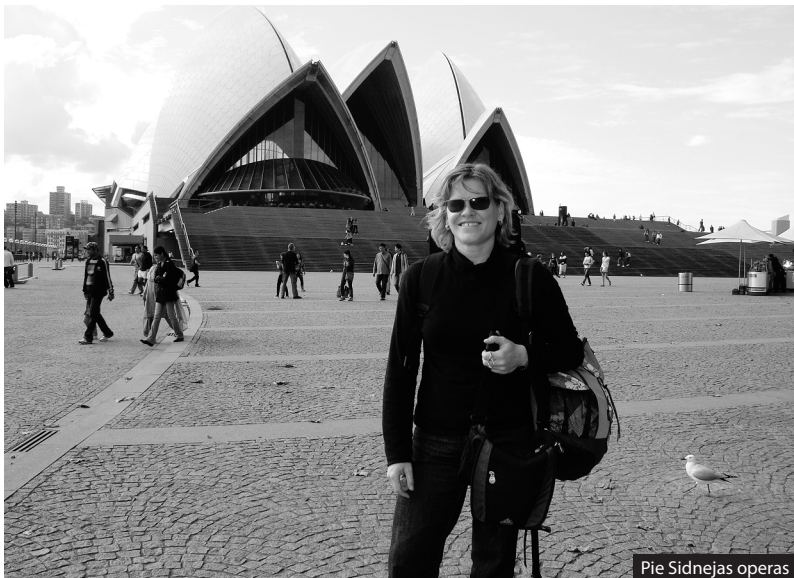
Pie Sidnejas operas