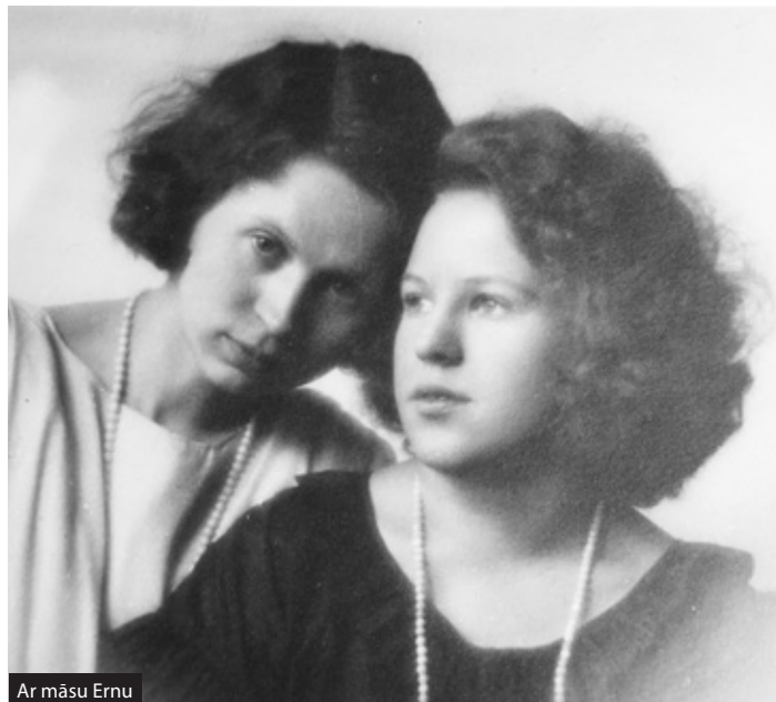
Ar māsu Ernu

‘Komponists’ ir starp tām profesijām, kas mūžības kontekstā iegūst tādu kā starpstāvokli. Vai arī var pretendēt uz diviem mūžības stāvokļiem vienlaicīgi: turpinot dzīvot mūžīgo zemes dzīvi mūzikā pat pēc aiziešanas mūžībā, kur visi reiz fiziski aiziet. Turklāt komponista 50, 150, 300 gadu jubilejas koncerti reizēm atšķiras tikai ar paša gaviļnieka klātbūtni vai neklātbūtni.