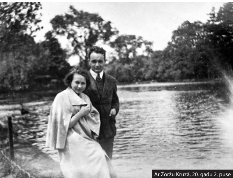
Ar Žoržu Kruzā, 20. gadu 2. puse

apvienot šķietami pretējo. No vienas puses, tas ir augsts lidojums caur neatrisinātu akordu secībām, krāšņām, netercu struktūras septakordu un paralēlo trijskaņu rindām, izteiktu plagalitāti. Tomēr sarežģītās harmoniskās sistēmas veido labskanību un ievibrē dvēseles tālākās stīgas, atstājot saldsērīgu minorīgā mažora pēcgaršu. Komponiste radījusi iespaidu par sevi kā emocionāli jūtīgu, tomēr stipru personību, kas spējusi savas dzīves traģiskos mirkļus pārvērst lielā cilvēcīgā spēkā un mīlestībā pret darbu.