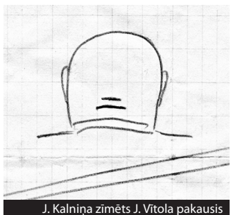
J. Kalniņa zīmēts J. Vītola pakausis