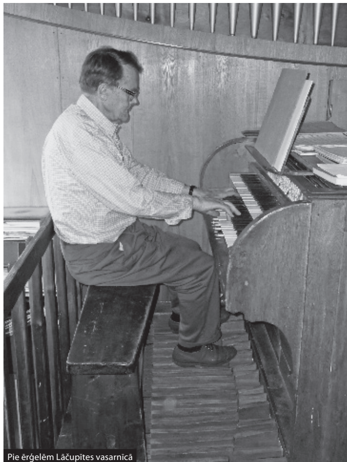
Pie ērģelēm Lāčupītes vasarnīcā