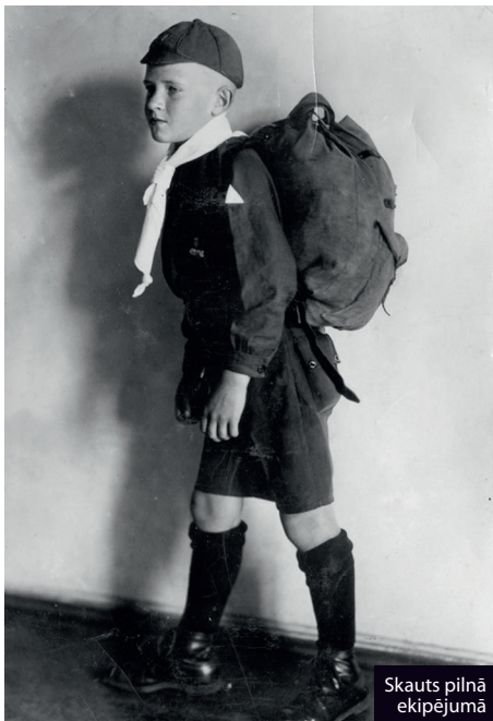
Skauts pilnā ekipējumā

“Padomju Jaunatnes” 19. decembra laidienā Oļģerts Grāvītis piesauc Induļa Kalniņa dziesmu “Tam nenotikt” solīstam, korim un orķestrim – izsaka atzīnību, taču arī brīdina