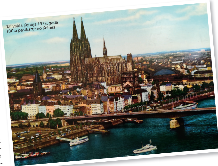
Tāļivalda Ķeniņa 1973. gadā sūtīta pastkarte no Ķelnes