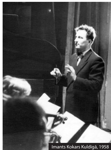
Imants Kokars Kuldīgā, 1958

Par to, ka mūsu slavenie brāļi – koridirģēšanas grandī Imants un Gido Kokari – jaunībā vadījuši studentu estrādes orķestri, plecus rausta pat laikabiedri. Un tomēr, kaut gan nav saglabājušās nekādas skaniskas liecības par kolektīva varējumu, ir dažas programmiņas, atmiņas un fotogrāfijas, kas ļauj dokumentēt šo interesanto darbošanos.