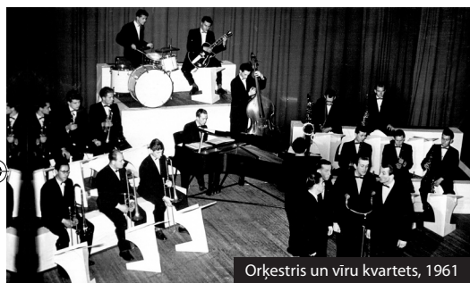
Orķestris un vīru kvartets, 1961