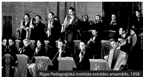
Rīgas Pedagoģiskā institūta estrādes ansamblis, 1958