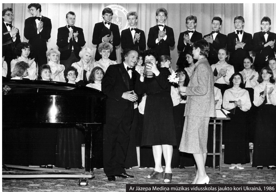
Ar Jāzepa Medīna mūzikas vidusskolas jaukto kori Ukrainā, 1986