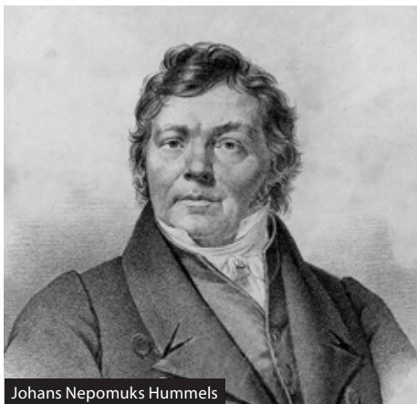
Johans Nepomuks Hummels

Hummela vieta 19. gadsimta pianisma attīstībā ir nozīmīga – stilistiski starp Mocartu un Šopēnu viņš bija ļoti populārs laikabiedru vidū. Kad 1822. gadā Maskavā satikās Hummels un Filds, abi atskaņoja Hummela Sonāti klavierēm četrrocīgi op. 92. Aptuveni šajā pašā laikā – 1822. gada 24. martā – Pēterburgā ar Hummelu redzējās poļu pianiste Marija Šimanovska ( Szymanowska ) un veltīja savstarpēji viens otram jaunradītus opusus.