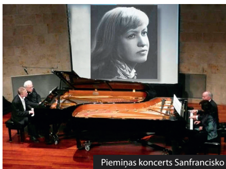
Piemiņas koncerts Sanfrancisko