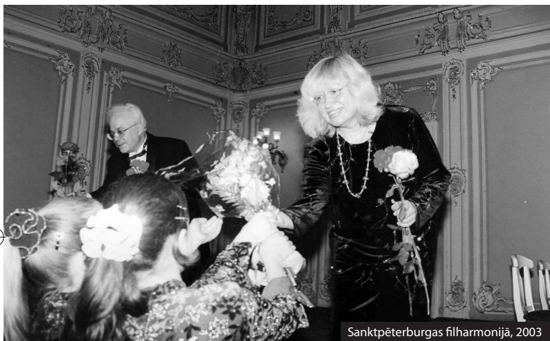
Sanktpēterburgas filharmonijā, 2003