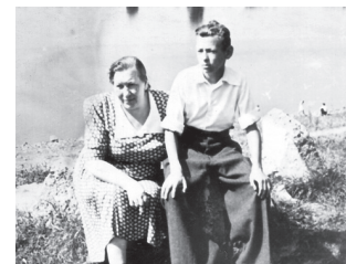
Daugavas krastā ar mammu. 1955. g.