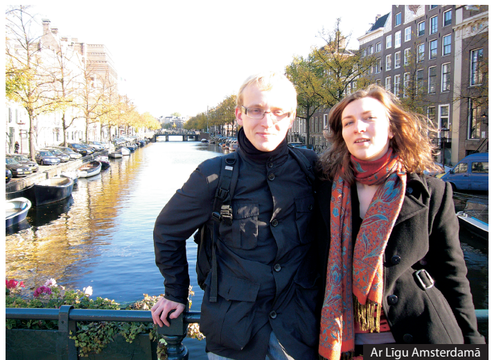
Ar Līgu Amsterdamā

KP: Tā pati "Mijkrēšļa dziedājumu" trešā daļa. Tas ir ļoti skaisti, kā tās glāzes plīst. Burvīgi.