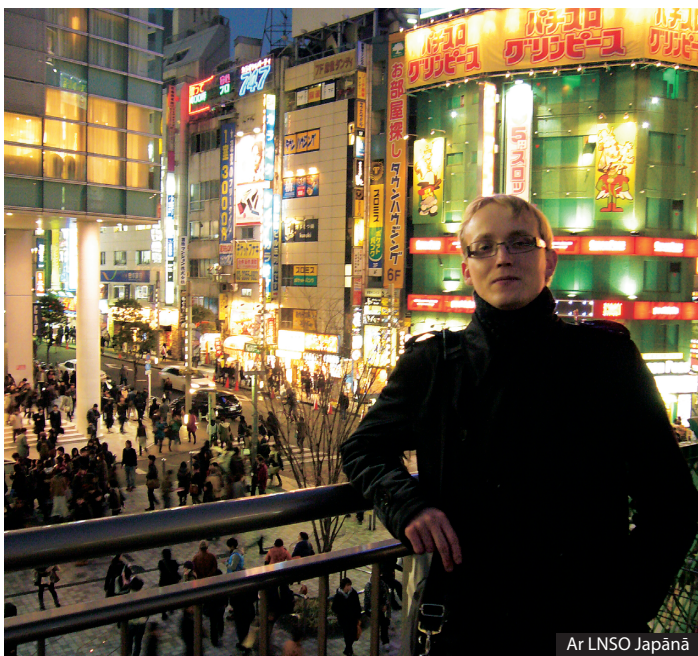
Ar LNSO Japānā