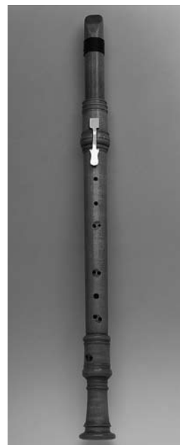
J. K. Dennera šalmejas kopija