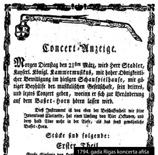
1794. gada Rīgas koncerta afiša