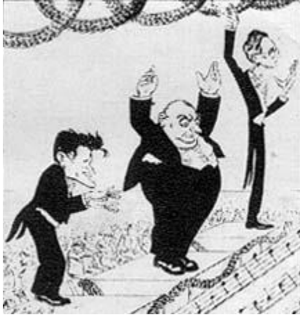
"VIII Dziesmu svētku virsdiriģenti" - V. Zosta draudzīgs šaržs