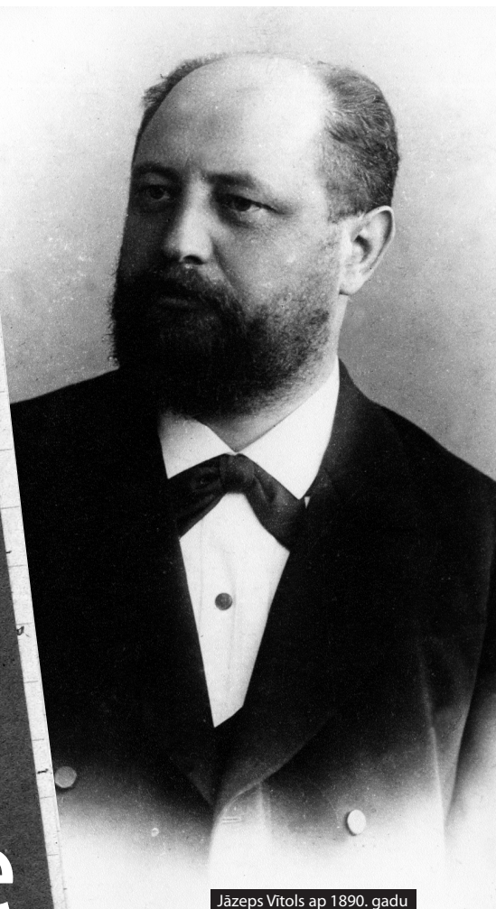
Jāzeps Vītols ap 1890. gadu