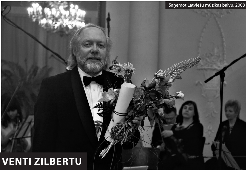
Saņemot Latviešu mūzikas balvu, 2008