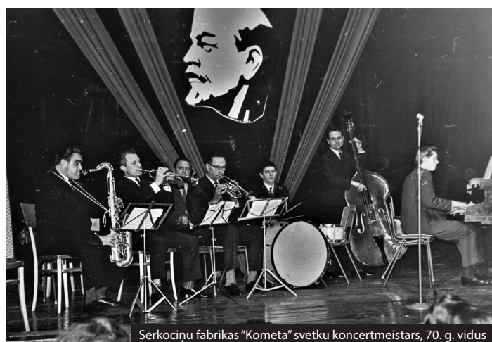
Sērkočiņu fabrikas "Komēta" svētku koncertmeistars, 70. g. vidus