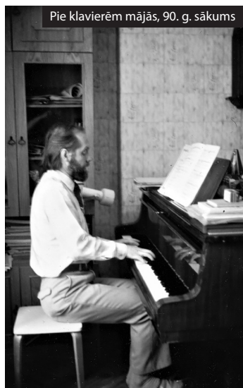
Pie klavierēm mājās, 90. g. sākums